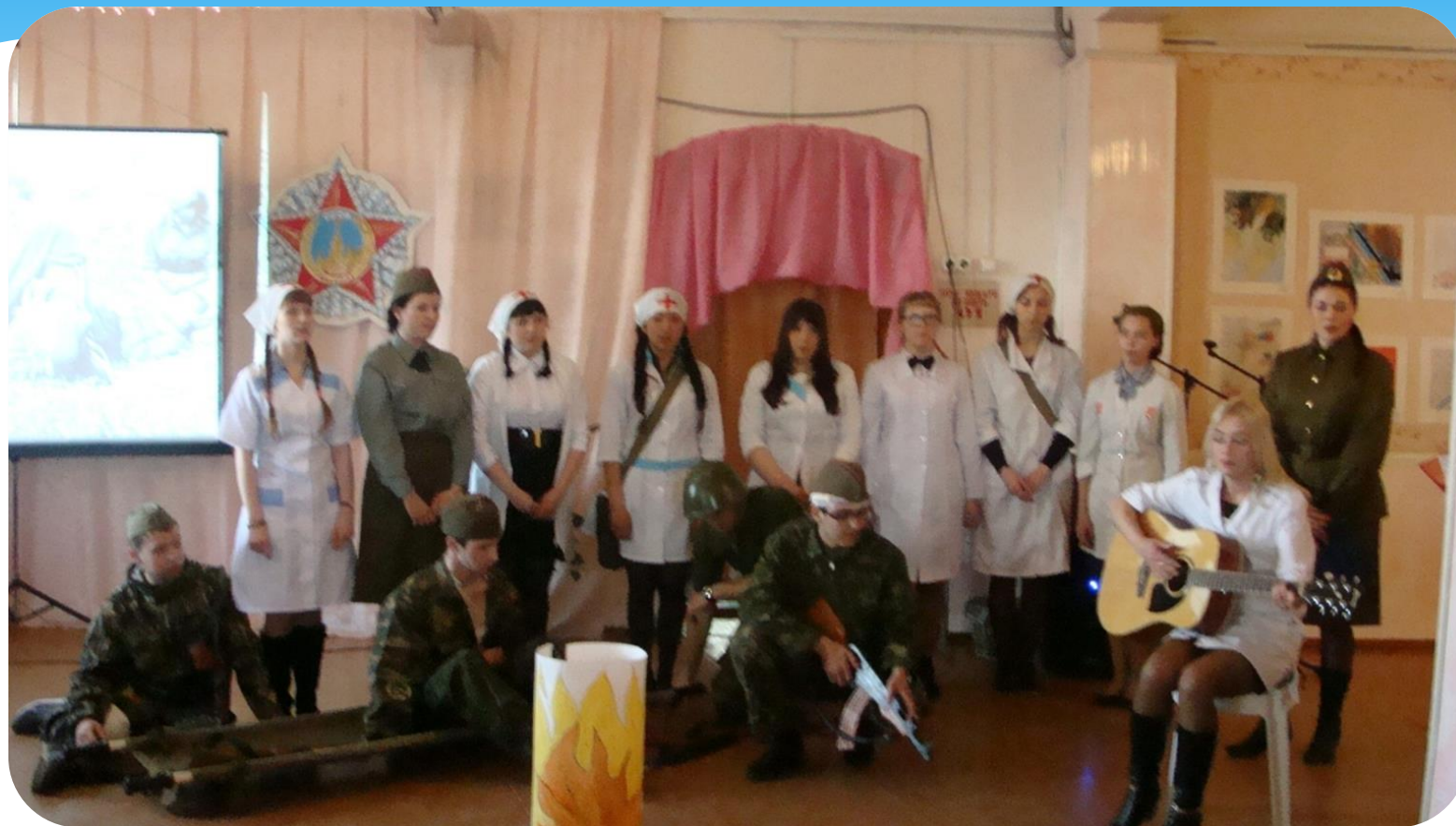
Фестиваль военной песни в ДДТ

«Кто сказал, что надо бросить песни на войне? После боя сердце просит музыки вдвойне!»